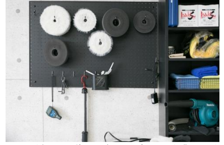
▲こだわりの道具の数々。全て手作業で行う。