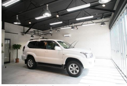
▲解放感溢れるガラス張りの店内。 設備にも一切の妥協はない。