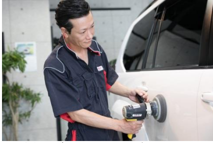
▲1台仕上げるのにかかる日数は4~7日。 コツコツと根気のいる作業が続く。

その後、司法書士の知人を頼って事業計画書などの書類を整え、さまざまな手続きを完了。物件探しに奔走した末に決めた、建って間もないガランとした倉庫も黒を基調としたシンプルモダンな内装に仕上がり、今年3月に「REVOLT 高知」が誕生しました。